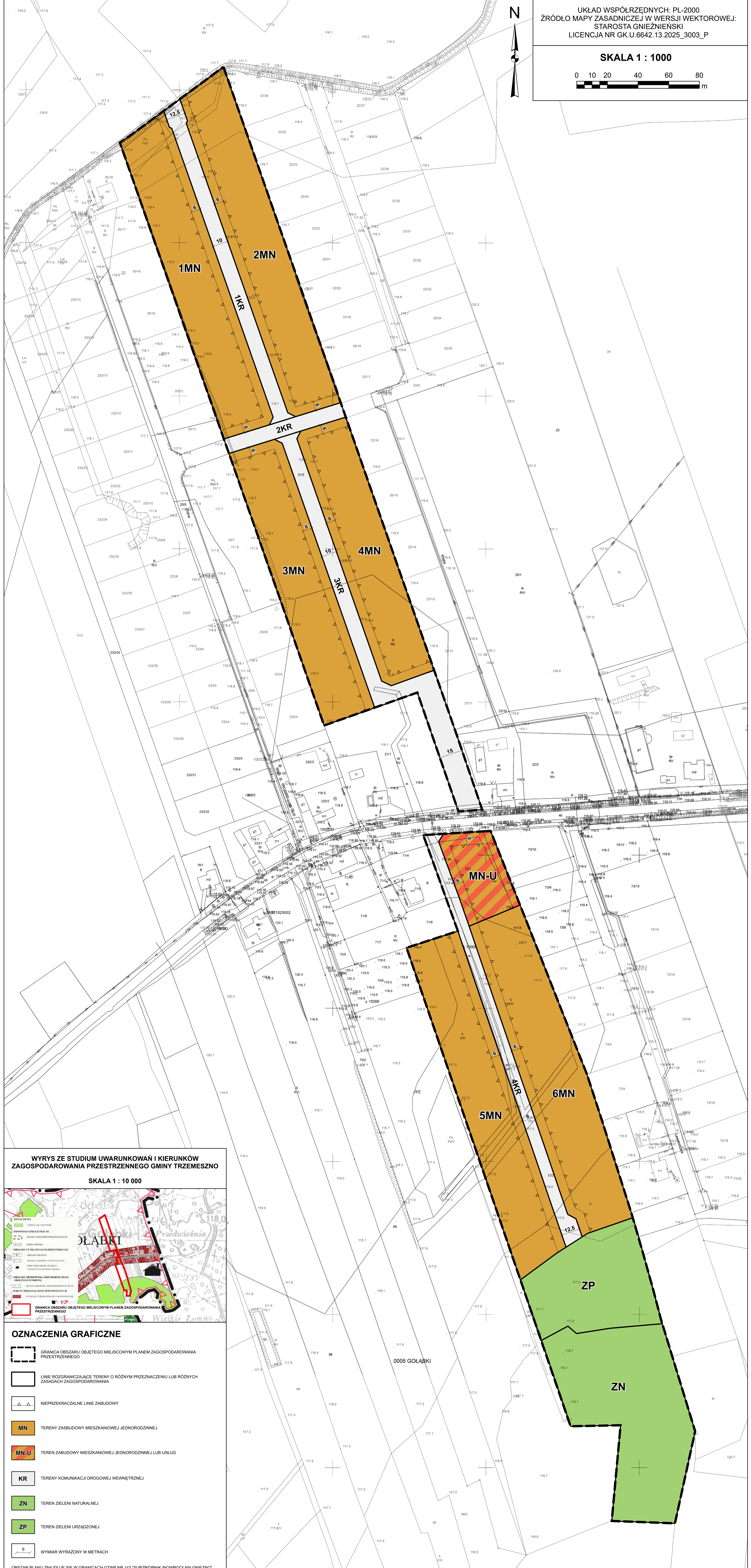
WYRYS ZE STUDIUM UWARUNKOŃ I KIERUNKÓW ZAGOSPODAROWANIA PRZESTRZENNEGO GMINY TRZEMESZNO SKALA 1 : 10 000