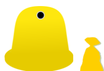
METALE I TWORZYWA SZTUCZNE